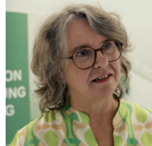
Petra Kriegeskorte

Bildungsmesse www.BINEA.de Stadthalle Reutlingen Netzwerk-Stand /Foyer & Fachkräfte-Lounge /1.OG