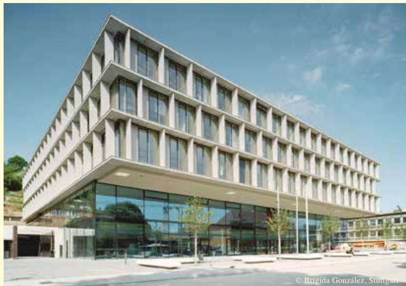
IHK Region Stuttgart, Jägerstraße 30, 70174 Stuttgart