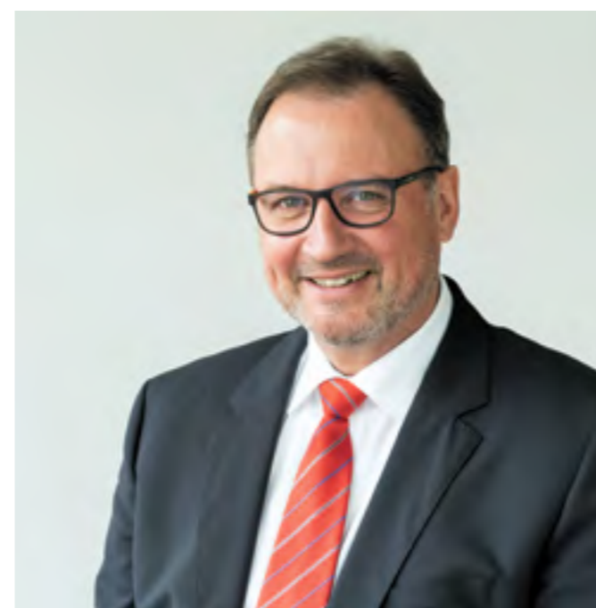
Landrat Joachim Walter

Joachim Walter Landrat des Landkreises Tübingen